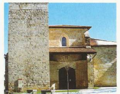
Iglesia juradera de la Virgen del Rosario