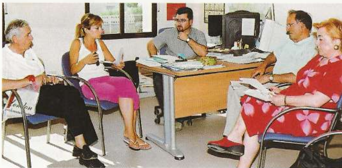
La Presidenta de la Comisión de Cultura, con representantes del CEAS y de asociaciones medinesas.