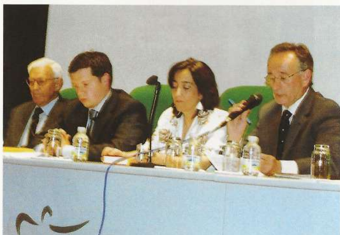
La autora acompañada por representantes de los entes organizadores