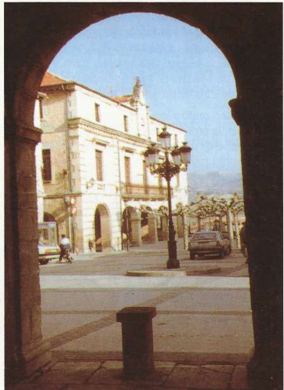
Casa Consistorial y Plaza Mayor.