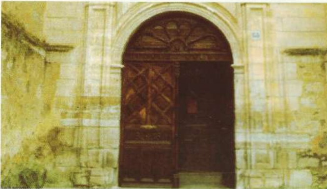
Portada Iglesia de San Pedro