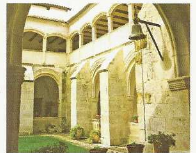
Claustro del Monasterio de Santa Clara, edificio BIC