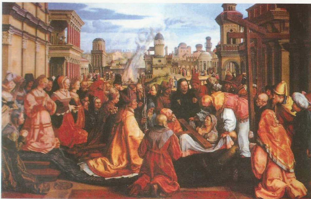
La emperatriz Elena encuentra la Vera Cruz, según el pintor alemán del siglo XVI, Barthel Beham. Santa Elena viajó a Tierra Santa con el fin de encontrar la Cruz en la que murió Jesús, y logra encontrarla con la ayuda de un judío llamado Judas.

Las Ordenes de Caballería y las Cofradías nobiliarias han pasado a ser condecoraciones, algunas de gran prestigio, como el Toisón o la Jarretera y han perdido la exigencia de nobleza de origen. Constituyen una lista de personas eminentes premiadas. Al haber abandonado la exigencia nobiliaria, continúan manteniendo el fin para el que fueron creadas: distinguir a los mejores.