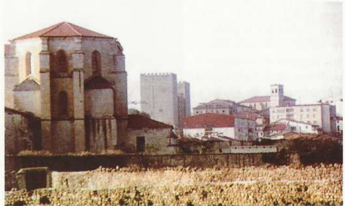
Visión general de la ciudad con Santa Clara en primer término

La guinda de toda la oferta cultural lo es el Alcázar -monumento nacional- con su museo histórico comarcal, y lo es por partida doble, por el valor que reúnen las piezas y elementos que alberga en cada una de sus salas y el edificio en sí por el creciente número de visitantes que registra.