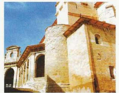
Parroquia de Santa Cruz

Alcázar de los Condestables -monumento nacional- alberga el Museo Histórico Comarcal.