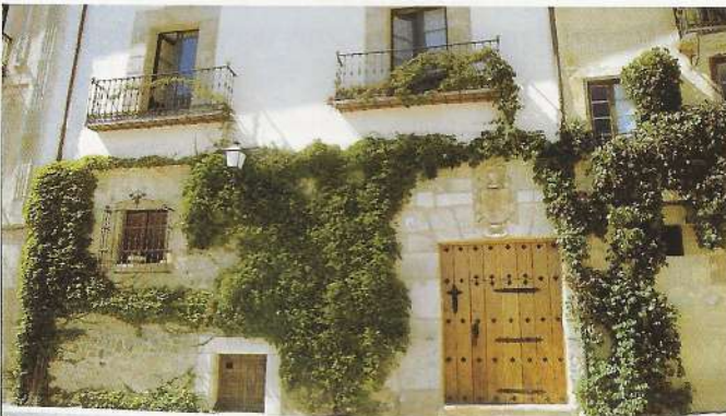
Casona en Calle Santa Cruz