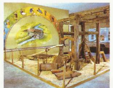
Sección de Etnografía del Museo