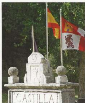
Las banderas ondean en el monumento.

Pero el grupo de Taranco no pensaba así. Los hermanos Vítulo y Ervigio declaran que sus padres los han educado en la defensa de sus derechos y en la defensa de sus derechos con valentía "nihil formidantes" (sin temor a nada). Los de Taranco eran pocos y pobres, en el fondo de un valle sin interés político. Pero su derecho era España, de mares a mares. Ni ellos sabían el volumen y peso de las dificultades. Pero, así como habían ejercido su derecho en el valle tras pasar los montes, lo ejercerían en los páramos y lo mantendrían sin temor a lo largo de los grandes ríos peninsulares. La marcha caerían los mejores, pero al final España quedaría para quienes habían superado los horribles miedos.