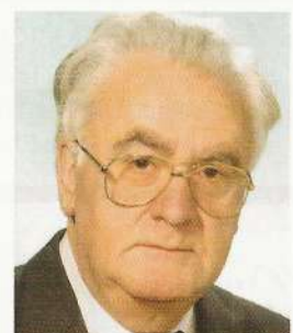
Fray Valentín de la Cruz

Las puertas del Procurador del Común están abiertas a todos los ciudadanos