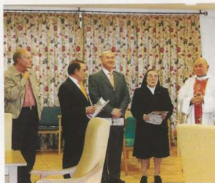
Momento de la inauguración del salón Hnos. Aperribay

La inauguración estuvo precedida por una misa de acción de gracias, concelebrada por el Párroco y don Pedro Fernández. Las Hermanas Salesianas del Sagrado Corazón de Jesús y residentes estuvieron acompañados por el Alcalde, representantes de las asociaciones locales, miembros de la Junta de Patronos y familiares de los residentes. Después de la bendición de las instalaciones y las palabras del presidente y del Alcalde, se efectuó una detenida visita a las mencionadas instalaciones.