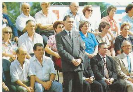
Representantes de la Junta de C. y L., Diputación, Ayuntamiento de Mena y otros. Taranco 15.9.1991.