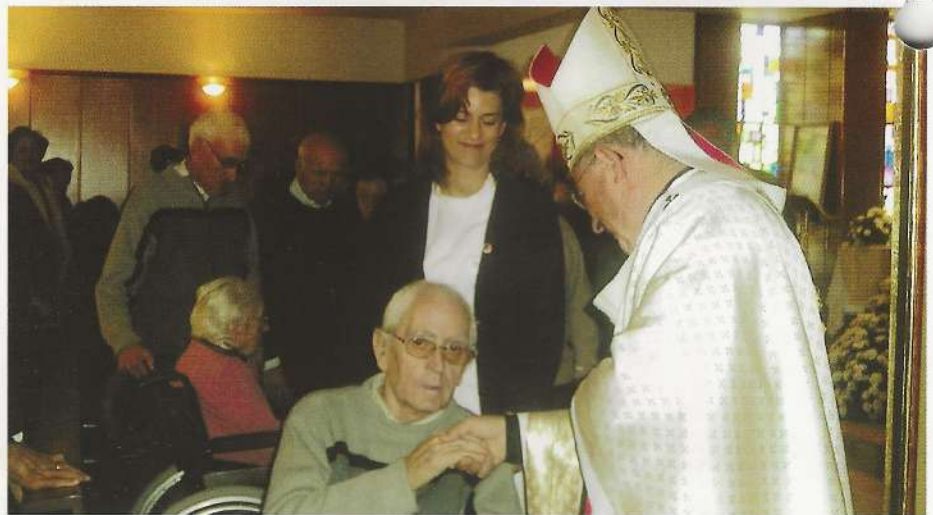
El Sr. Arzobispo saludando a los ancianos.

Entre estos dos actos que conforman el marco de la Visita Pastoral, está el cuadro de las celebraciones, encuentros, reuniones con grupos, visitas a Colegios, visitas a enfermos y religiosas de clausu-