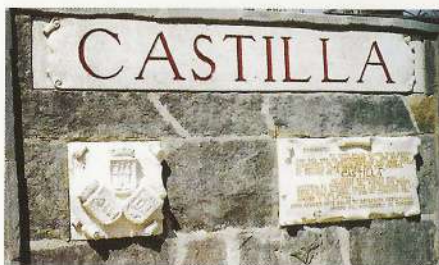
Monumento dedicado por los Amigos de Taranco al nacimiento de la palabra Castilla.

Pero no podemos desoir las exigencias de nuestra lengua. Todos debemos extremar ante ella las atenciones que merece. En este sentido todos hemos de considerarnos responsables y miembros activos de nuestra Real Academia, cuyo lema de conducta ante la Palabra es tajante: "Limpia, fija y da esplendor..." Hay peligros de degeneración lingüística española en la ignorancia, en el desaliño hablante de muchos, en la pobreza y grosería de otros muchos hispanohablantes, la despreocupación de algunos medios de comunicación, en la artera pretensión de erradicar el castellano de algunas Autonomías peninsulares, con desacato de la razón y de nuestra Constitución.