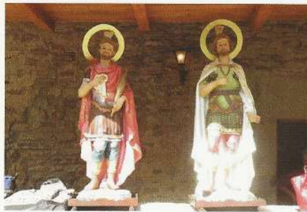
Santos Mártires, Emeterio y Celedonio.

La personalidad de Abú Amir, el Victorioso, ha merecido los más estruendosos aplausos y los más contundentes denuestos. En este milenario de su muerte, en Medina Celi, se ha oído de todo en su loa y desprecio. Hemos de reconocerle su inigualable capacidad de intriga y la contundencia de sus campañas militares. Abrasó a las capitales de todos sus oponentes cristianos; ardieron Barcelona, Pamplona, San Millán de la Cogolla, León y Santiago de Compostela.