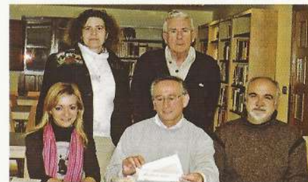
Directivos con la Concejala de Cultura.

Se han actualizado las bases de acuerdo con el calendario. También se ha incorporado un capítulo sobre el premio comarcal. Se ha sometido a la consideración de la Concejalía de Cultura y del Museo Histórico. Una vez recibidas las sugerencias, se procederá a la redacción definitiva y se solicitará el patrocinio de este premio Merindades.