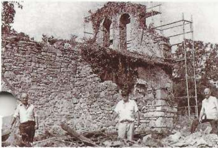
Vecinos de Taranco en la restauración de la iglesia de San Medel. Verano 1994.

ficaz y actuante en el espinazo de España. Dentro de la ancha Castilla estamos con encanto y orgullo en la parte más NGUA es uno de nuestros valores substanciales. Así se estrena nuestro Cronista al consultarle sobre el significado, ori-