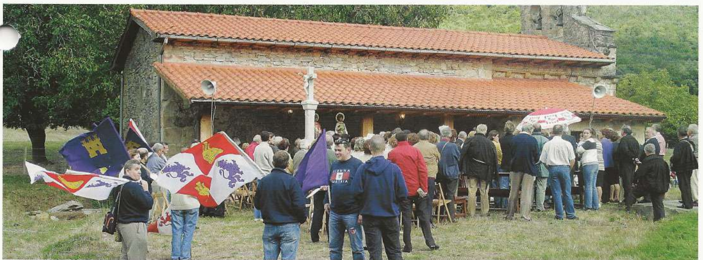
Taranco en el Día del Nombre de Castilla