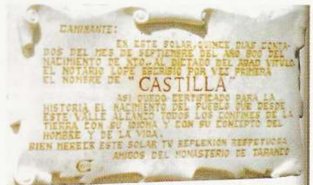
Dedicatoria de Fray Valentín de la Cruz

La cultura patrimonial que hoy gozamos los castellanos es proverbial por su brillantez y su abundancia a pesar de los expolios y de otras plagas. Podemos estar orgullosos al mostrárselo a los forasteros; pero que no se nos olvide que hemos de entender nosotros nuestros aspectos culturales y custodiarlos y defenderlos. Es nuestro derecho y nuestra obligación.