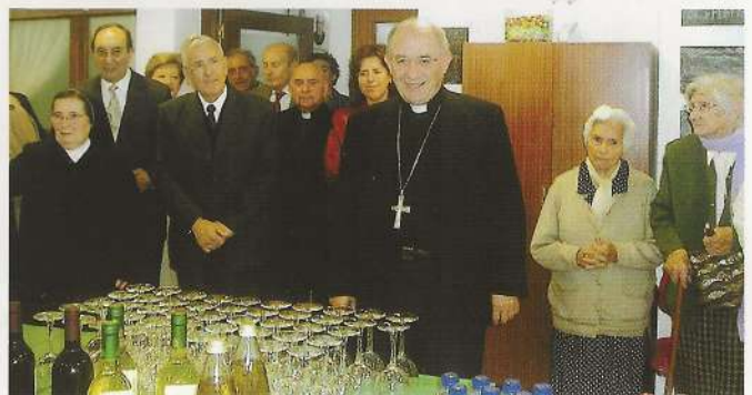
Don Francisco departió con los ancianos, con las Hermanas Salesianas del Sagrado Corazón de Jesús, con los miembros de la Junta de Patronos y público.