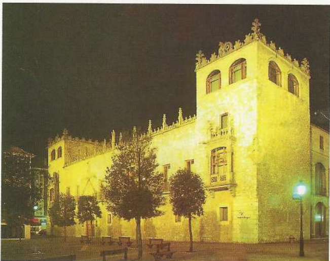
Casa del Cordón de Burgos