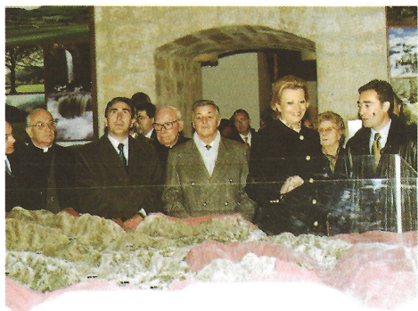
La Presidenta y acompañantes ante la maqueta que describe la geografía comarcal.