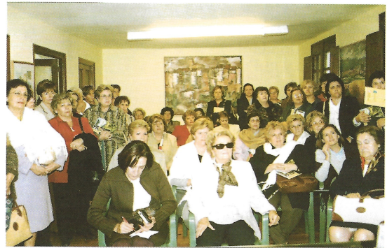
Aspecto de la sede de los Amigos durante la visita.