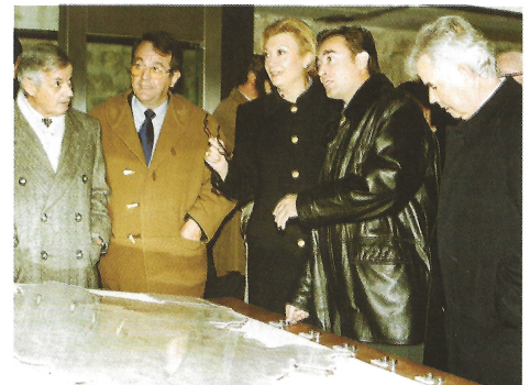
Comprobando el carácter didáctico de los paneles explicativos.