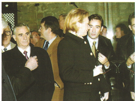
El director del proyecto explicando el dinetel geminado, con arcos de herradura, flor de lis y ave, de Rosales.

La Presidenta del Congreso de los Diputados inauguró el lunes 26 de Noviembre el museo histórico comarcal de Las Merindades, ubicado en el Alcázar de los Fernández de Velasco. Poco antes de descubrir la placa conmemorativa que lleva su nombre, Luisa Fernanda Rudí afirmó que sólo compartiendo inquietudes y conociendo la historia, podemos comprender mejor los orígenes. El turismo interior -prosiguió- está unido a la cultura y una prueba de ello lo es este museo. La señora Rudí concluyó señalando que el mismo "llenará de satisfacción a los vecinos y contribuirá a la investigación, el ocio y la cultura".