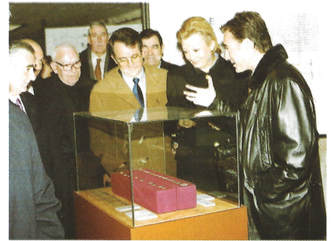
Conociendo la presencia romana en la comarca a través de las monedas.