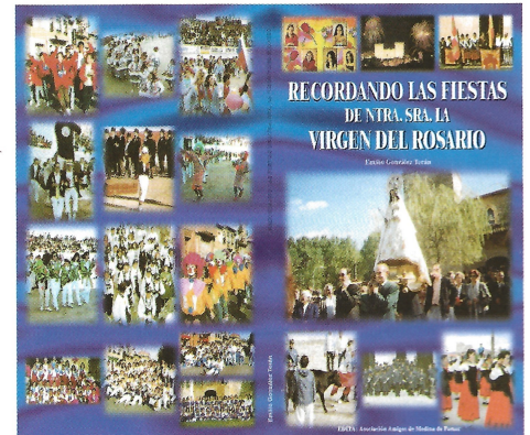
Recordando las Fiestas de Ntra. Sra. la Virgen del Rosario.