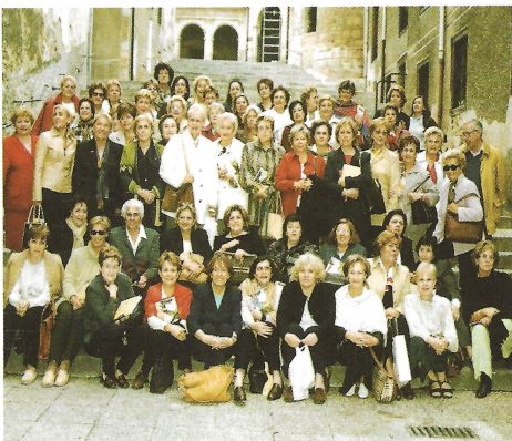
La Federación Nacional de UNAE visito la Ciudad

La Presidenta del Congreso de los Diputados inauguró el Museo Histórico de Las Merindades, en el Alcázar, el lunes 26 de noviembre.