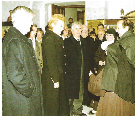
La Presidenta del Congreso y su séquito en Santa Clara