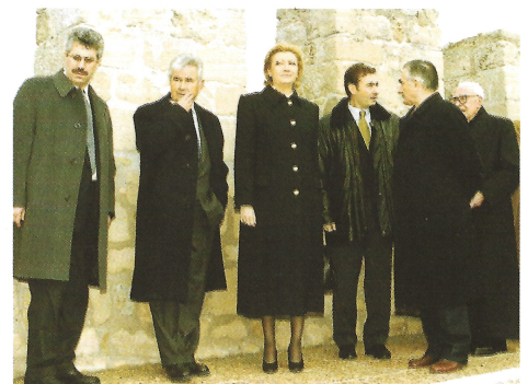
Desde las almenas de la terraza del Alcázar, la presidenta Rudí disfrutó de la visita del entorno.