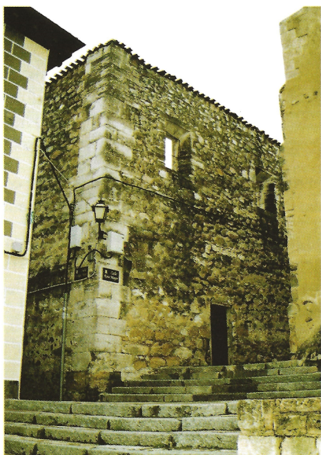
Oratorio San Felipe Neri