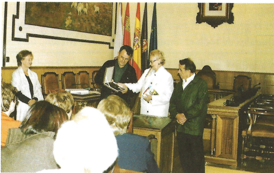
Recepción municipal a UNAE en el Salón Consistorial.