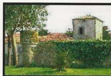
Torre Medieval de los Velasco. Noja