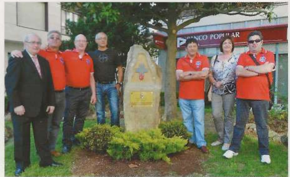
Compañeros de la delegación y grandes donantes de España