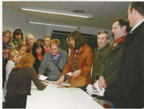
Momento de los autógrafos