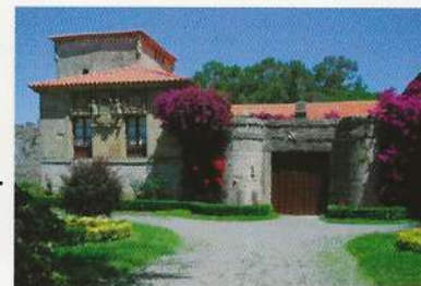
Palacio de los Marqueses de Velasco