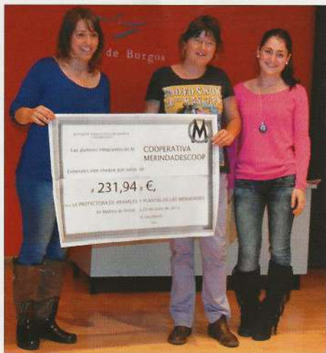
La representante de la protectora con el talón recibido