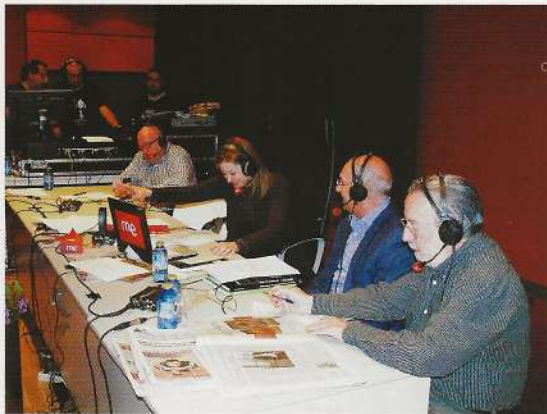
Durante la entrevista al Alcalde

días que fue seguido con interés por cientos de personas, bien "in situ", desde cada domicilio, centros de trabajo, en viajes,... Al término de cada una de las emisiones, la popular presentadora firmó tarjetas-fotografías a cuantas personas se acercaron a felicitarla por su programa.