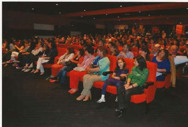
Como es habitual, la asistencia y el buen ambiente está garantizado