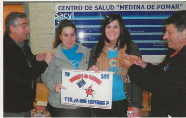
Donantes, vuestro testimonio es ejemplar, mueve sentimientos.

La celebración de esta jornada universal en la ciudad de los Condestables resultó participada por autoridades, representaciones, La asamblea general de la Organización Mundial de la Salud ha declarado el 14 de junio fecha para reconocer el papel del delegado de Medina de Pomar la celebración de esta jornada. Fue el día siguiente, sábado 15. Los distintos actos celebrados conducta en materia de salud pública y concienciar sobre la necesidad de sangre y productos sanguíneos.