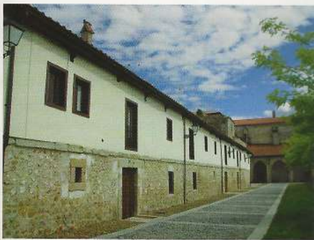
Casitas del compás

El cuadro de "La Adoración de los Reyes" , óleo sobre tabla de escuela flamenca y que parece corresponder al final del siglo XV, es otra pieza a destacar de este museo, donde también podemos encontrar otro lienzo que representa a la "Sagrada Familia con Santa Ana" , obra de Hendrick Leckere (1570-1630). El Relicario de los Siete Círculos, el Cristo de Lepanto, la carta de fundación del Monasterio de Santa Clara (1313), una colección de textiles litúrgicos, y un largo etcétera, son otras de las muchas maravillas que podremos observar en este museo.