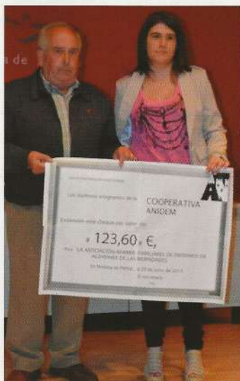
Entrega del donativo a AFAMER