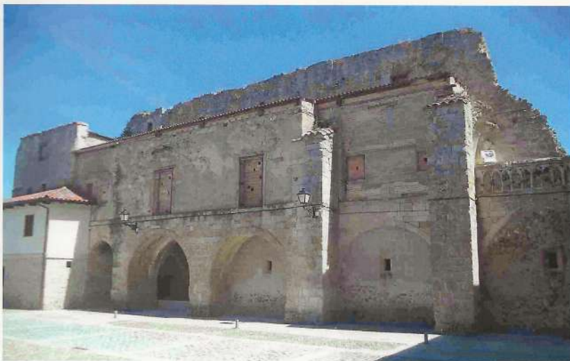
Fachada oeste del hospital de la Vera Cruz, desde el compás del Monasterio

Convertida Medina de Pomar en el centro de acción de los poderosos Velasco de Castilla Vieja, el siguiente paso a dar sería la expansión señorial y después jurisdiccional. Todavía en el reinado de Enrique IV los Velasco tenían una concesión importante en el marco de la administración, tal es el título de Condestable otorgado en 1473 al designar a Pedro Fernández de Velasco Condestable de Castilla por haber quedado vacante el reino a la muerte de Miguel Lucas Iranzo. Aquel título fue confirmado y mantenido por los Reyes Católicos en el mismo personaje, Pedro Fernández de Velasco, quien moriría en 1492. A su muerte le sucedió su hijo Bernardino Fernández de Velasco.