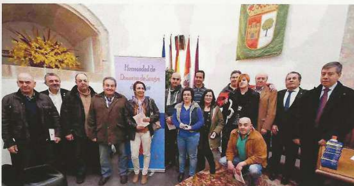
Otra vista de la sala del Alcázar