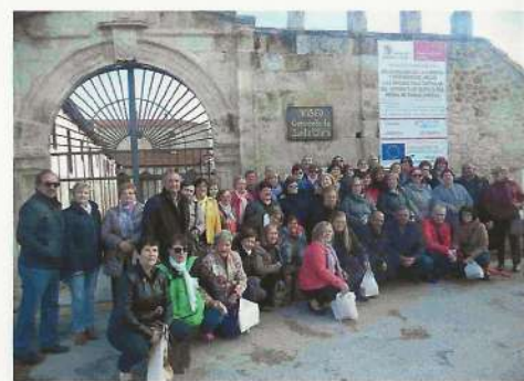
En la imagen el colectivo riojano posando a las puertas de entrada, visitó el museo el último día de abril. Aprovecharon su estancia para probar las exquisiteces de la repostería de las hermanas clarisas, quedando prendadas de su hojaldre

que en parte les recordó a su desaparecido convento de la misma orden. Consultados algunos de los visitantes, valoraron, entre otros, el retablo mayor y la capilla de la Inmaculada Concepción, los artesonados y especialmente el Cristo yacente de Gregorio Fernández, "la joya artística del monasterio".