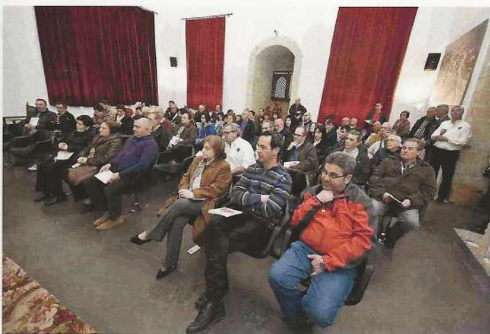
Aspecto que ofrecía la sala del Alcázar durante la Asamblea

Francisco del Amo recordó que si España va a la cabeza del mundo en trasplantes de órganos también es debido a la contribución de los donantes de sangre. Pidió al delegado local la continuidad en el cargo y animó a todos a aspirar a conseguir en 2017 las 800 donaciones.