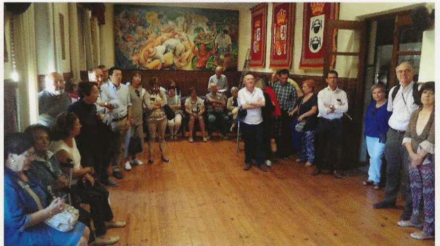
Durante la recepción en el ayuntamiento de Herrera de Pisuerga

La tarde se empleó en visitar las exposiciones de las Edades del Hombre en Aguilar de Campoo donde finalizó la segunda jornada de este foro de la Casa de Velasco.