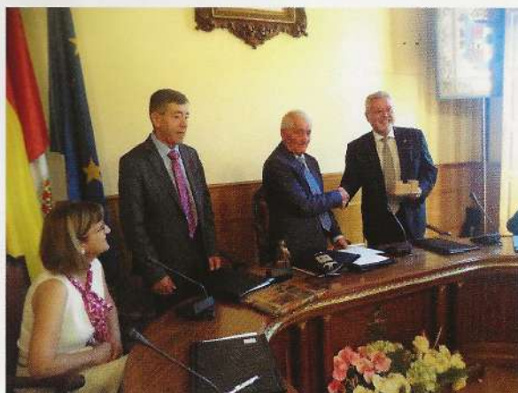
Intercambio de obsequios