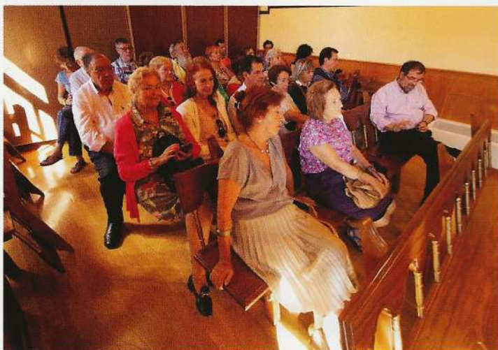
Parte del público existente