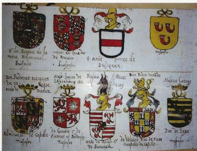
Tapiz armonial de Bruselas. Finales s. XVI (conservado en la Galería Uffizi, Florencia)