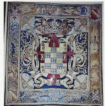
Armas de D. Juan Fernández de Velasco Quinto duque de Frías (c.1.550-1.613)