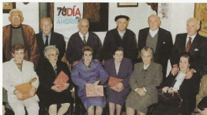
La Caja del Círculo de Burgos homenajeó a los matrimonios en sus bodas de oro.

Con motivo de la 78 edición del Día Internacional del Ahorro, las oficinas de estas entidades de crédito y ahorro -Caja de Burgos y Caja Círculo de Burgos-, por separado, celebraron esta efemérides homenajeando a los matrimonios que durante el presente año han celebrado sus bodas de oro matrimoniales.