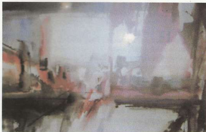
Acuarela de Richard Pérez, "Fantasía en rojo", primer premio edición 2002

L as salas inferiores del Alcázar lucen una colección de los cuadros premiados en los Concursos de Pintura organizados por la Asociación de Amigos de Medina de Pomar. En total los cuadros premiados que han pasado a formar parte del patrimonio medinés suman 27 obras de arte, distintas representaciones que ofrecen otras tantas visiones de motivos medineses. Son obras realizadas por artistas de reconocido prestigio y su calidad es patente.