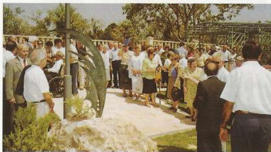
Aspecto que afrecía el entorno de la residencia.