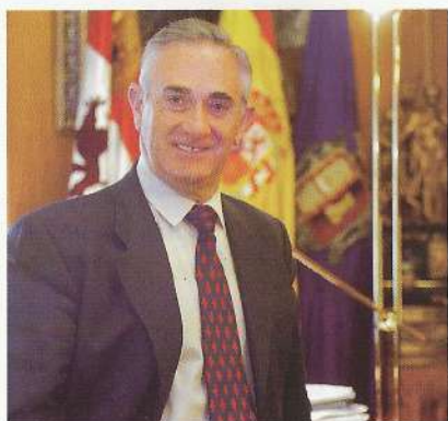
Vicente Orden Vígara. La Diputación dispuesta a apoyar proyectos empresariales.