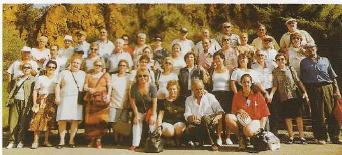
Grupo de excursionistas en Cabárceno.

Con esta perspectiva en el horizonte de nuestras actuaciones, se han realizado excursiones a Cantabria (2), con visitas a Potes, Fuente Dé (con ascensión a los picos en el teleférico), Santo Toribio de Liébana y San Vicente de la Barquera. Jornada agradable a la vista del estupendo reportaje gráfico de Miguel Sabando.