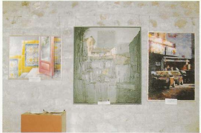
Las tres primeras del concurso