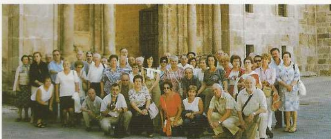
Los medineses en San Millán de la Cogolla, frente al monasterio de Yuso

La provincia de Valladolid, resultó elegida para la cuarta y última excursión de la temporada, en concreto la capital del Pisuerga se visitaron la Museos de Arte Contemporáneo y de la Ciencia, completando la jornada en Peñafiel (castillo, museo del vino y villa), con parada en la villa ducal de Lerma antes de emprender el regreso.