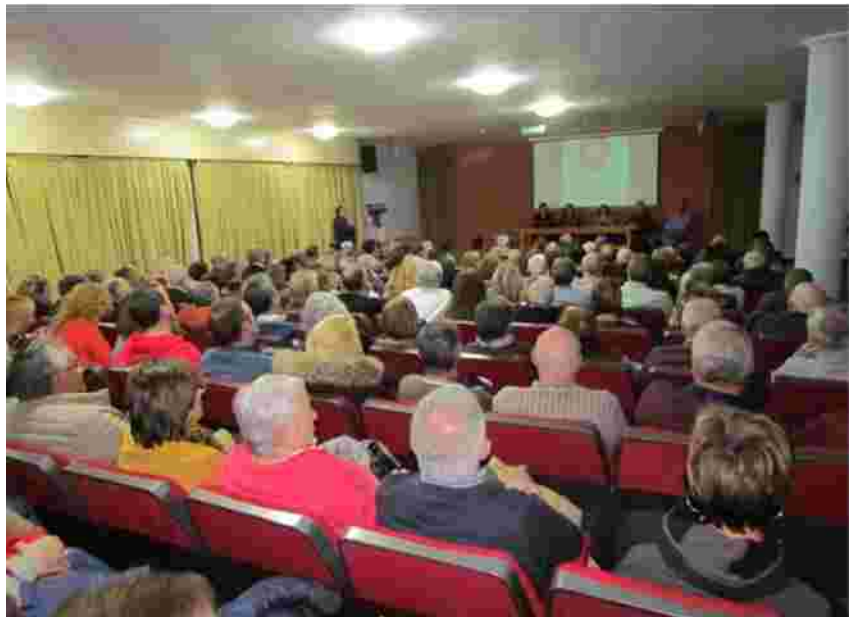
Acto de presentación de la Plataforma a la ciudadanía, 3 de noviembre de 2018

Después de un año de trabajo en común y una vez materializada la representación de Medina Vetula en la Junta Directiva de Amigos de Medina, el equipo de coordinación ha acordado la disolución de la Plataforma. Desde estas hojas de La Voz de los Amigos os vamos a mantener informados de diferentes aspectos relacionados con el Casco Histórico, esta vez nos centramos en el urbanismo: