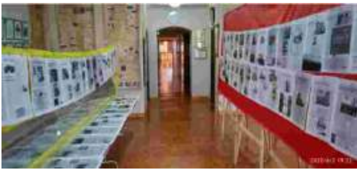
Del 3 de junio al 3 de julio de 2022, EXPOSICIÓN ILUSTRADA: "TAMBIÉN FUERON NOTICIAS: Diario de Burgos de 1985 a 1999", por Emilio González Terán.