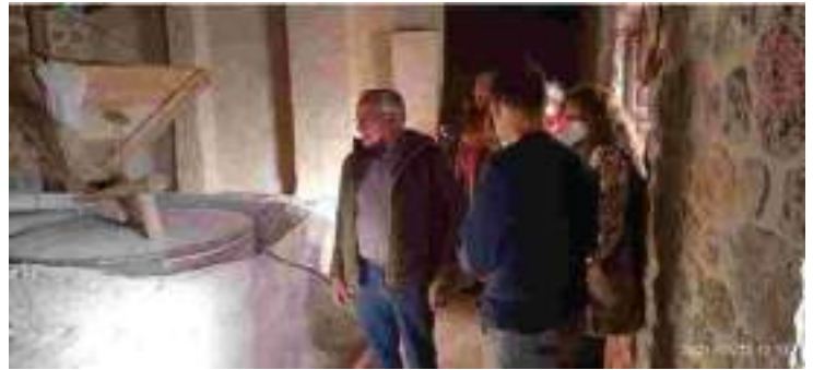
16 y 23 de abril de 2022, Rutas culturales por los molinos del canal del río Molinar