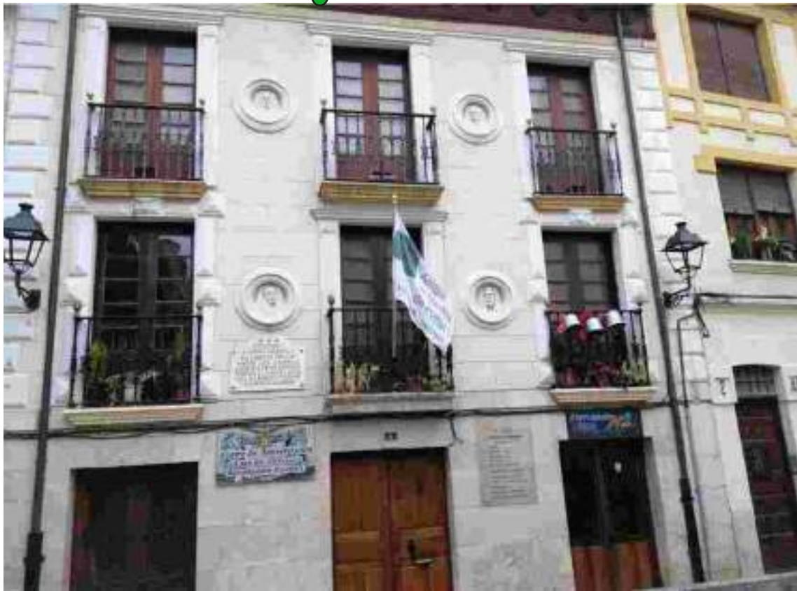
La bandera conmemorativa del 35º aniversario ondea en la sede de la Casa Roldán