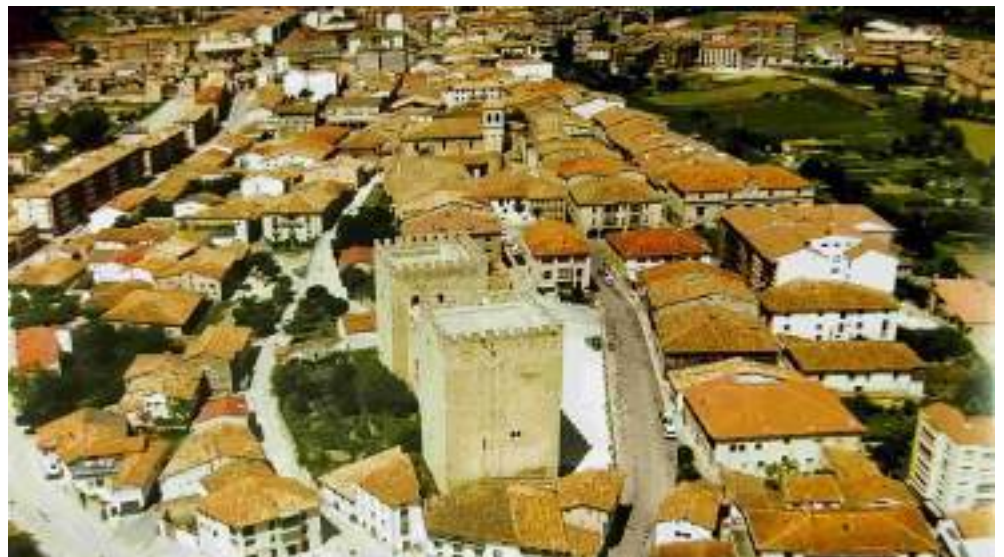
Casco histórico medinés, conjunto histórico nacional, donde destaca su Alcázar, edificado por Pedro Fernández de Velasco (+1384) y su esposa María Sarmiento, entre 1369 y 1380