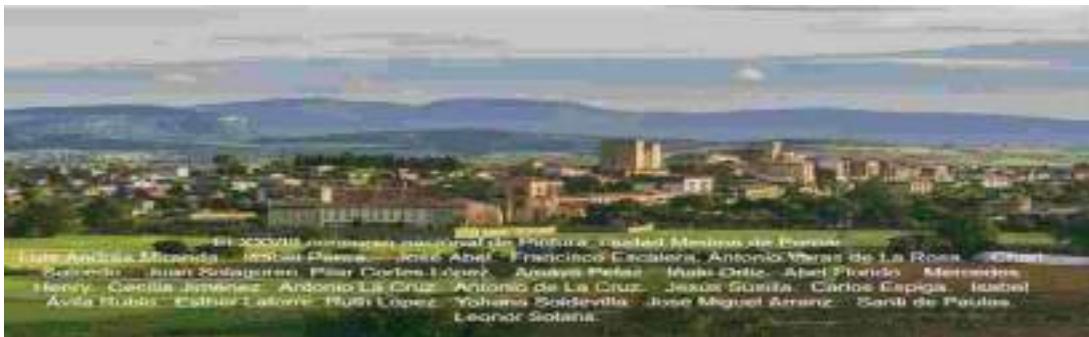
Del 6 al 27 de agosto de 2022, XXVIII Concurso Nacional de Pintura Ciudad de Medina de Pomar y exposición de los trabajos presentados