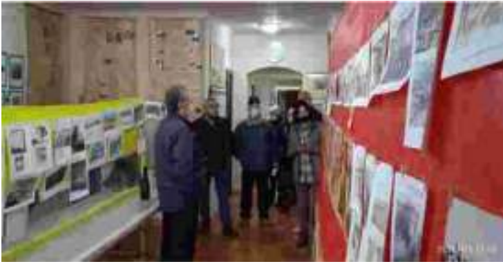
Del 1 de abril al 29 de mayo de 2022. 1ª Exposición de fotografías antiguas de Las Merindades, ¿nos prestas tus fotos antiguas del pueblo?