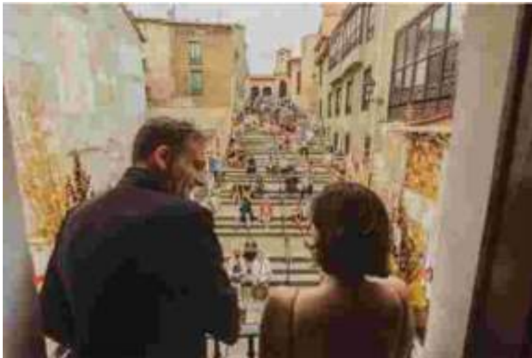
II festival lírico en los balcones de Medina de Pomar (14 de agosto de 2022)