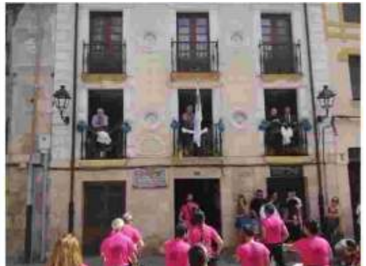
35º aniversario de la fundación de Amigos de Medina de Pomar