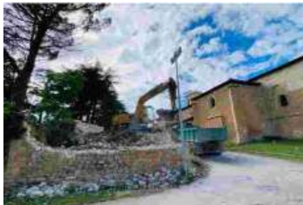
Derribo de la Casa del Beaterio, junio de 2021, para ampliar la curva de acceso al campo de fútbol

del derribo, ¿tiene explicación?. La protección del casco histórico de Medina presenta una enorme disparidad y crea desigualdades. El catálogo de los edificios del casco histórico es sumamente arbitrario, incluyendo algunos edificios o elementos de estos carentes de interés, y permitiendo la demolición de otros como la Casa del Beaterio, que contaba con un doble interés, histórico y arquitectónico. Somos partidarios de definir algún área o edificio de interés arquitectónico, eligiendo los que se estimen más viables de cara a su posterior ejecución, para su desarrollo mediante una arquitectura y un urbanismo que preserven y den continuidad a las tradiciones locales y que contribuyan a generar una estructura urbana armoniosa y socialmente integradora, fomentando el uso de materiales autóctonos, así como de soluciones tradicionales, diseños arquitectónicos y urbanos más comprometidos con la conservación del patrimonio cultural medinés. Siempre dentro del Casco Histórico, sin distracciones con elementos o actuaciones periféricas que no sean los urgentes y necesarios para un normal desenvolvimiento de la vida cotidiana de Medina.