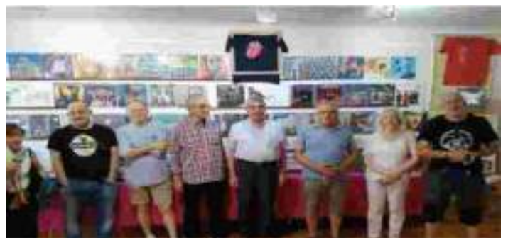
Del 3 al 28 de julio de 2022, 2ª EXPOSICIÓN DE VINILOS Y OTROS FORMATOS