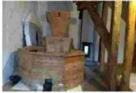
Imagen del interior del molino

Este molino ya tiene su nombre y su fecha colocados, y está pendiente de ponerlo en marcha su dueña, Arantxa.