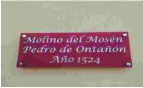
Cartel identificativo a la entrada del molino

Molino harinero de Mosén Pedro de Ontañón, de 1524, por Ángel Paz Cuevas