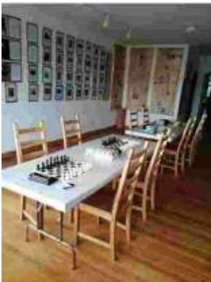
La que fuera casa de la familia Roldán, sede de la Asociación de Amigos y centro de interpretación de la Casa Velasco