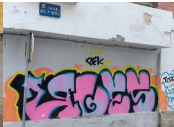
Pintada en calle Reina María Cristina.