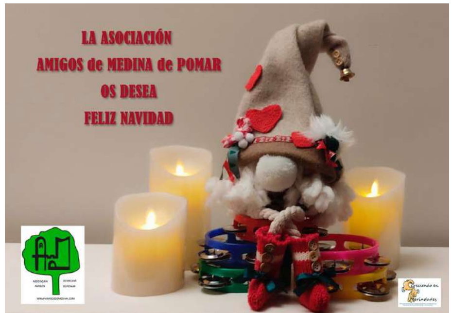
Felicitación navideña elaborada en colaboración con la Asociación Creciendo en Merindades

Celebrar la Navidad, para los que creemos en Jesús de Nazaret como el Hijo de Dios encarnado, es celebrar la ESPERANZA. Son muchas las personas, incluso pueblos, que han perdido la esperanza. Seguramente tengan motivos para ello, porque las guerras, la violencia, las injusticias, los sufrimientos provocados por los humanos, pueden llevar a la desesperación; sin embargo, poder celebrar un año más la Navidad significa, -más allá de las reuniones de amigos y familiares-, poner la confianza en el Dios de Jesucristo que es Dios de la Vida para todos, y que no sólo nos promete la vida eterna, sino que además ofrece la posibilidad de cambiar, de sanar corazones, de reconciliar, de instaurar unas relaciones más fraternas en este mundo dividido por las discordias y los egoísmos.