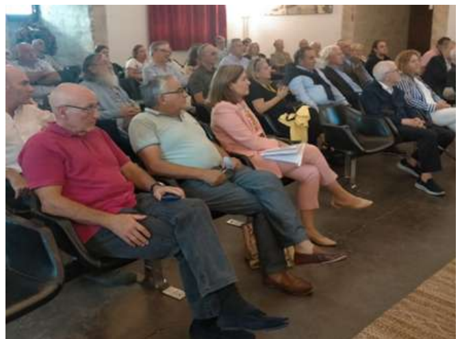
Aspecto parcial de la sala del Alcázar durante las conferencias.

de Velasco. Con el apoyo de diapositivas, realizó una breve introducción de las reales academias, mencionó los duques de Frías que se han formado en las reales academias y otros miembros del linaje pertenecientes a las reales academias.