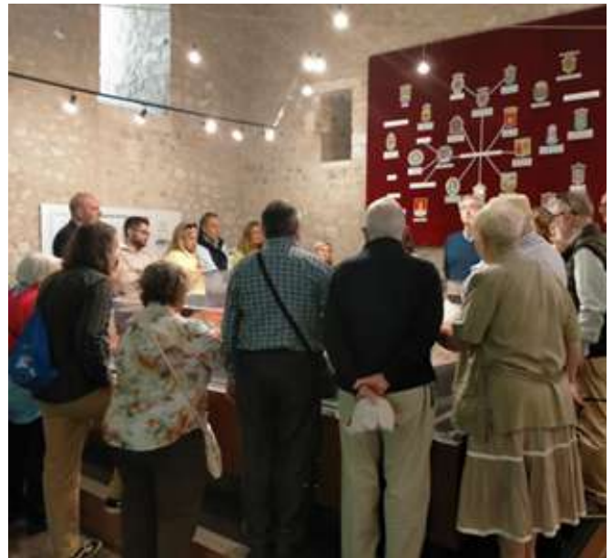
Los asistentes durante la visita al museo comarcal.

justicia y del derecho. El tiempo le fue dando la razón hasta ser reputado como "el buen Conde de Haro". Es necesaria mucha virtud -añadió- para que el vulgo le aplicase tal calificativo. A esta introducción le siguió una detallada descripción del personaje, que vio la luz el 4 de julio de 1401. Fue el primogénito de una familia de seis hermanos. Fundó el hospital de la Vera Cruz, repartió la dotación entre los veinte pobres, el personal al servicio de los residentes y la constitución de un pósito de trigo.