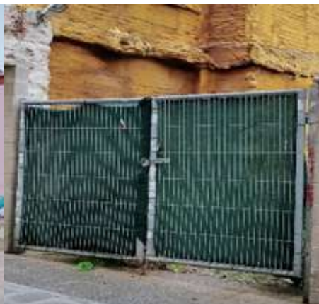
Solar donde estuvo la Fundación Villota.