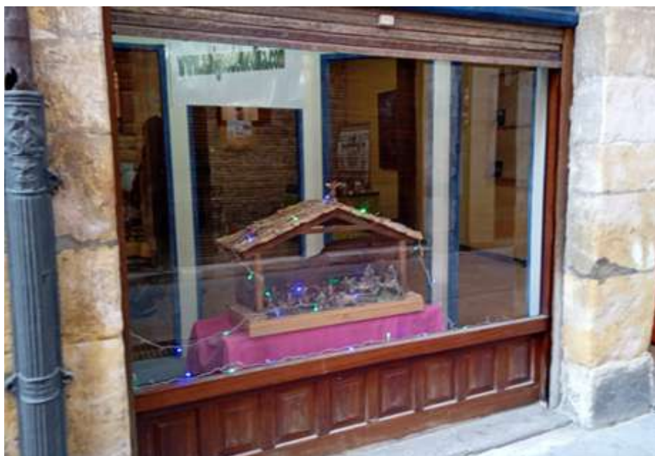
Nacimiento instalado en el nuevo local de la calle Mayor.

El 16 de diciembre se celebró un encuentro navideño en la sede en el que los asistentes recibieron la felicitación navideña que los niños y jóvenes de Creciendo en Merindades han elaborado para todos los socios. Con este encuentro de carácter solidario Amigos de Medina inicia su colaboración con el estupendo proyecto que sus vecinos están desarrollando en colaboración con la Fundación Residencia N º Sra. del Rosario.