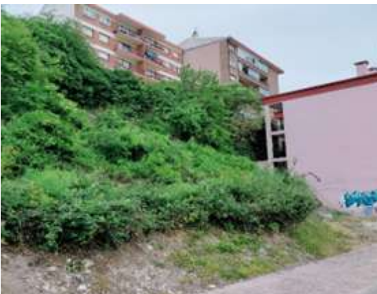
Matorral en calle Tras Las Cercas.

Como una imagen vale más que mil palabras, observen: